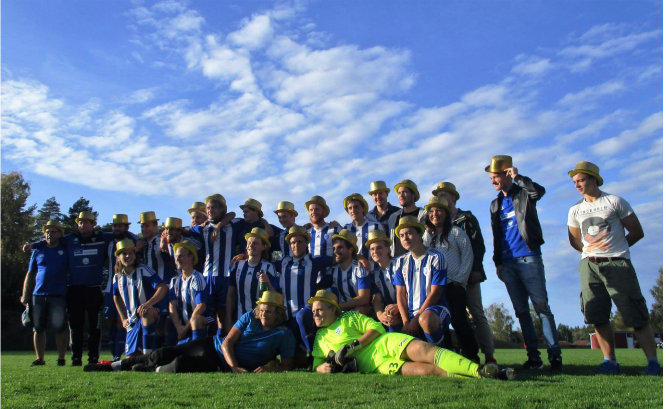
IFK:s fotbollslag vann serien och spelar nästa år i fyran. Det är 70 år sedan sist.